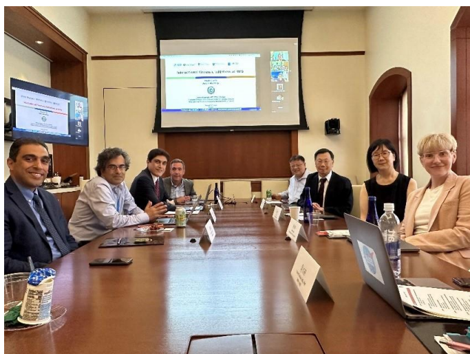
圖：亞大校長蔡進發（右 3）、亞大資工系講座教授黃光彩（右 4）、美國哈佛大學國際遺傳疾病中心的創辦主任 Alireza Haghighi 教授（右 6）及團隊成員交流、洽談合作。