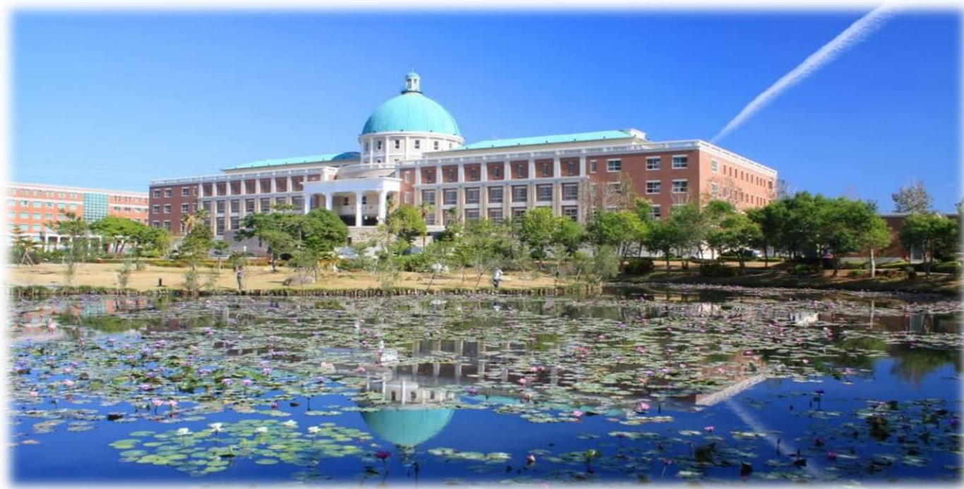
圖：就讀亞大，就是就讀一所「綜合大學」+「醫學大學」+「國際大學」