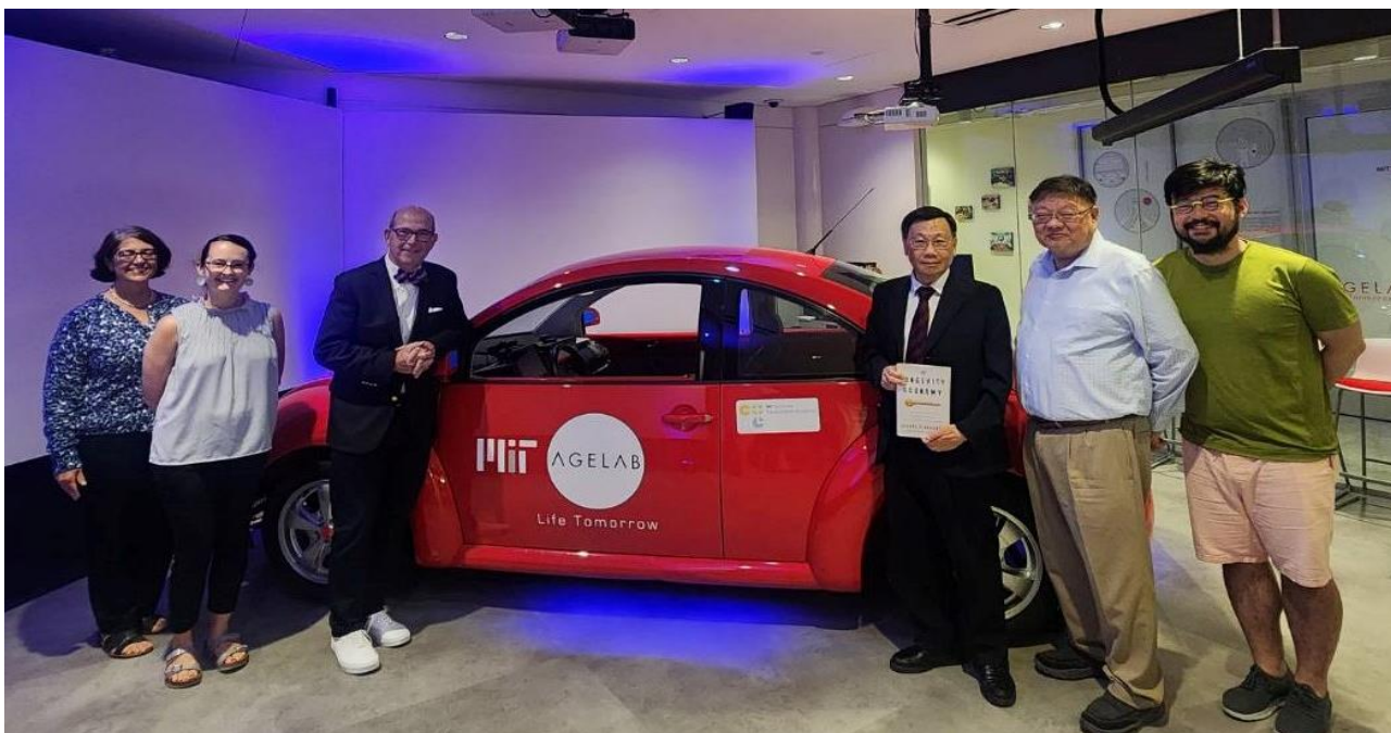
圖：亞大校長蔡進發（右 3）、亞大黃光彩講座教授（右 2），與 MIT AgeLab 年齡實驗室創辦人兼主任 Joseph F. Coughlin 教授（右 4）、AgeLab 團隊合影。