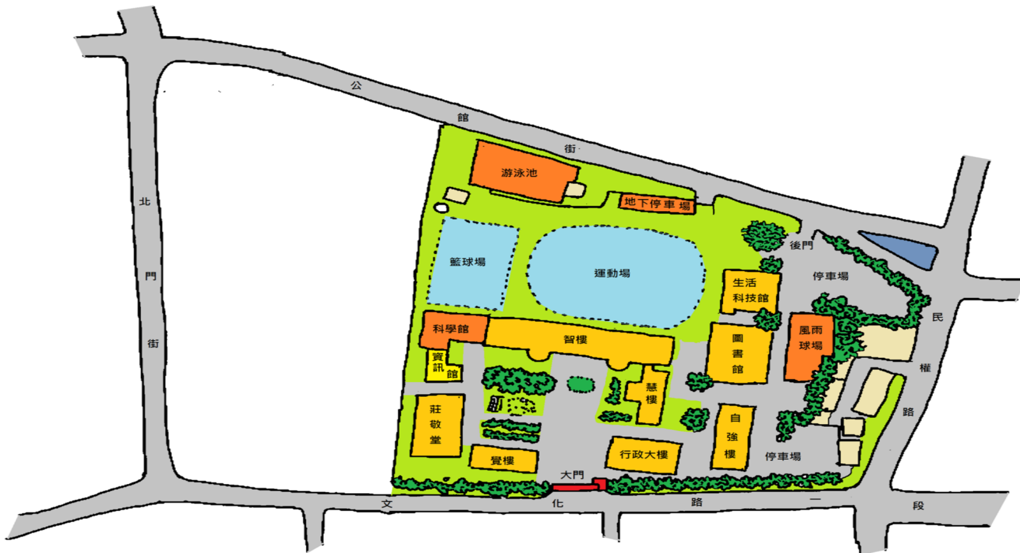
(1)板橋高中停車資訊：